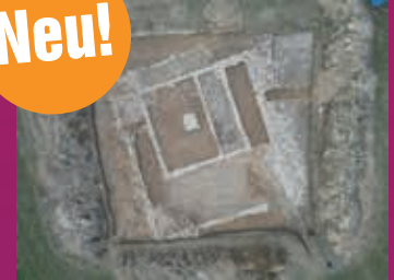
Ausgrabungsort in Emmersdorf