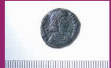
Spätantike Münze aus Rosegg

Nicht nur Kelten lebten in Rosegg, sondern auch Römer ließen sich an der Drau vor ungefähr 2.000 Jahren in Emmersdorf (ein Teil der Marktgemeinde Rosegg) und Rosegg nieder.